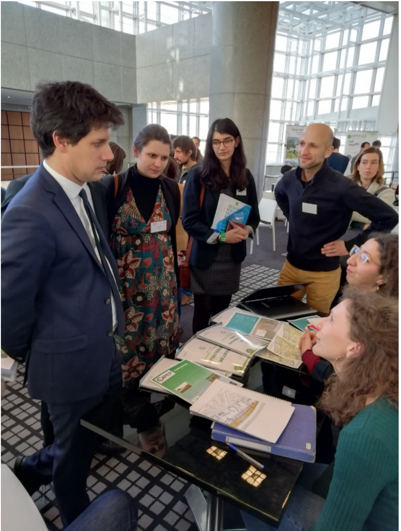
Le Ministre en charge de la Ville et du Logement, Julien Denormandie, à l'écoute des territoires NPNRU porteurs de projets d'agriculture urbaine soutenus au titre du PIA

Pour plus d'information, cliquez ici [7].