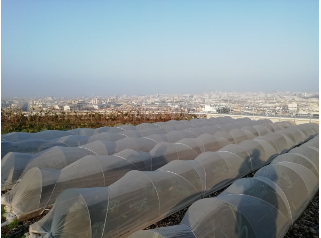
Visite de la micro-ferme en toiture avec Topager, Opéra Bastille de Paris